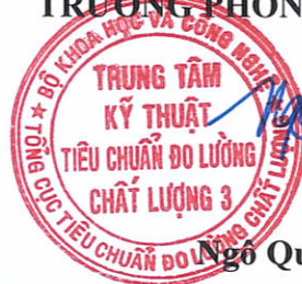
Ngô Quốc Việt